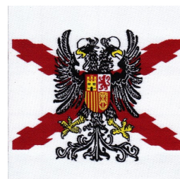
Medidas 6,8 x 6, 8 cm