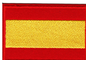
Medidas 7 x 4, 8 cm