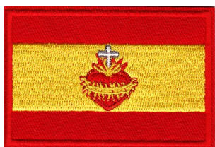
Medidas 7 x 4, 8 cm